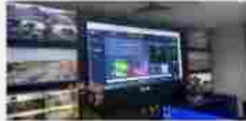
Smart Street Lighting