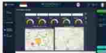
Air Quality Hotspots