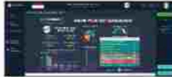
Smart City Dashboard