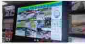
Smart Surveillance Integration Of New Analytics CCTVS