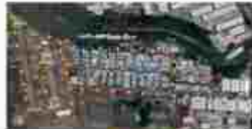
Integrated Operations Centre (IOC)